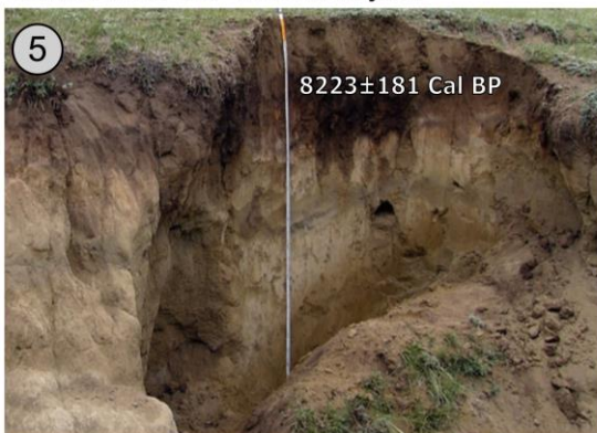
Разрез Куктанар, долина р. Чуи на переходе между Курайской и Чуйской котловинами, 1730 м н.у.м.