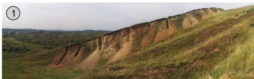
Средне-позднеплейстоценовая лессово-палепочвенная серия в карьере у пос. Красногорское, низкогорный северо-восточный Алтай