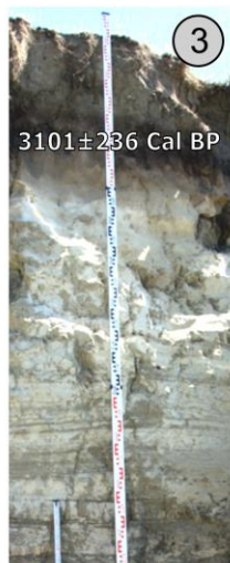
Разрез Баратал, старое русло р. Чуи, 1465 м н.у.м.