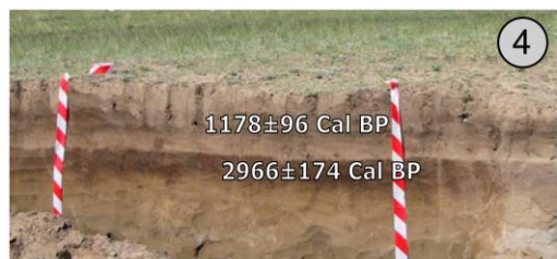
Разрез Куктанар, долина р. Чуи на переходе между Курайской и Чуйской котловинами, 1730 м н.у.м.