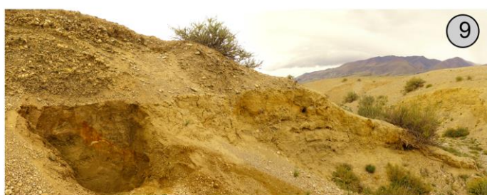
Переотложенные Неогеновые отложения с признаками плейстоценового педогенеза у подножия Курайского хребта, Чуйская котловина, 1780 м н.у.м.

Почвенно-литологические серии по маршруту полевого палеопочвенного семинара XIV ISFWP-2020. Номера профилей соответствуют номерам объектов на карте маршрута.